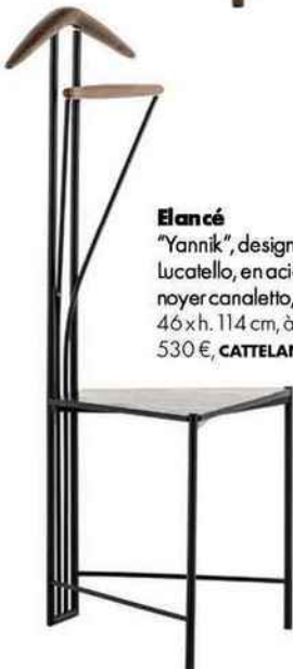
Elancé "Yannik", design Andrea Lucatello, en acier laqué et noyer canaletto, l. 40 x p. 46 x h. 114 cm, à partir de 530 €, CATTELAN ITALIA.