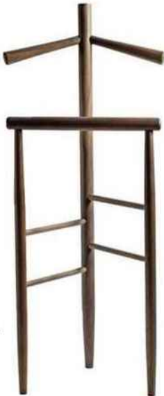
Dress code "Mori", design Giulio Iacchetti et Alessandro Stabile, en noyer massif, l. 45 x p. 30 x h. 105 cm, INTERNOITALIANO.